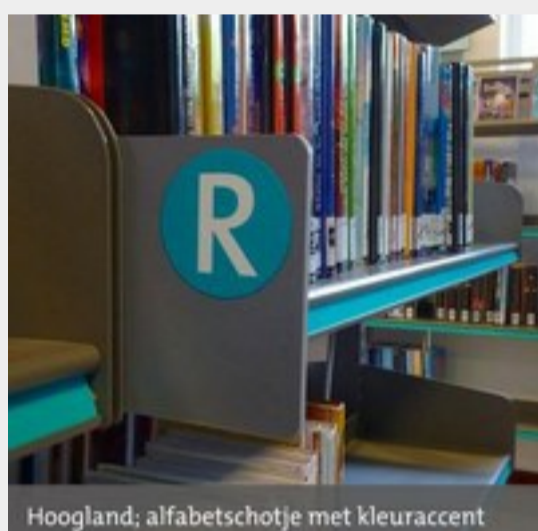
Hoogland; alfabetschotje met kleuraccent

Voor de bezoekers / gebruikers van uw bibliotheek is het ideaal als hoofdgroepen of "Werelden" duidelijk te herkennen zijn. Natuurlijk staat dat groot aangegeven op de muur of op borden boven de kast. Door de kasten echter te voorzien van gekleurde rubriceringsstrips wordt ook heel duidelijk waar de groep begint en waar die eindigt . Deze kleurrijke begrenzing is niet alleen heel praktisch voor uw klant, maar zorgt tevens voor een frisse uitstraling van uw bibliotheek. Dus ook de ideale oplossing om een bestaande inrichting te "pimpen". Klik op de foto voor meer productinformatie.